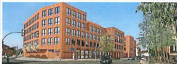
So könnte der blick über die bahnhofskreuzung auf das Gebäude aussehen - die Schriftzüge sind zunächst symbolisch, Mieter stehen noch nicht fest.